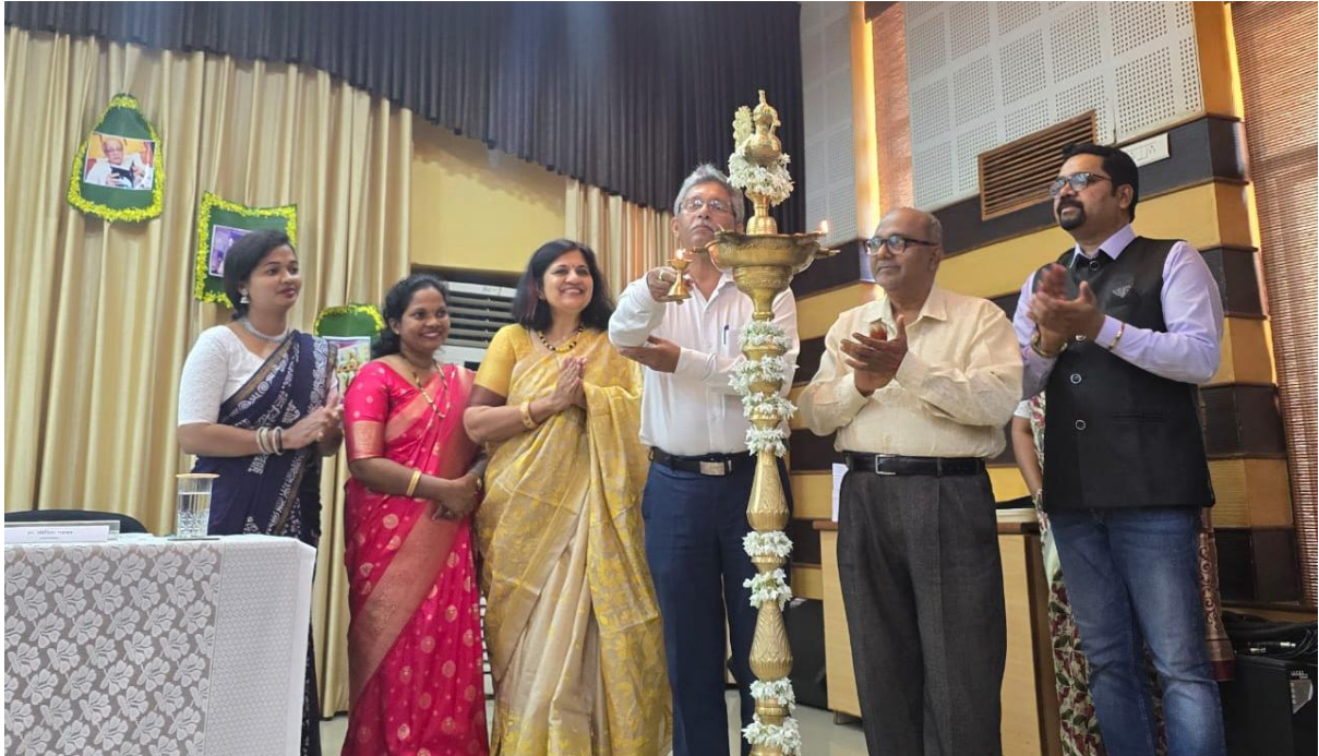
Inaugural of two days National Seminar to celebrate the Birth Anniversary of Jnanpith Awardee Ravindra Kelekar