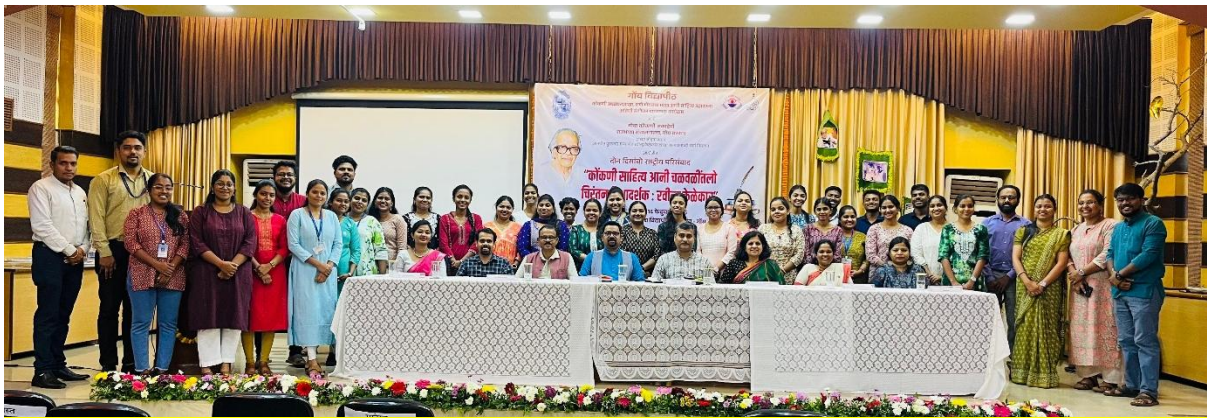
Group photo of concluding session