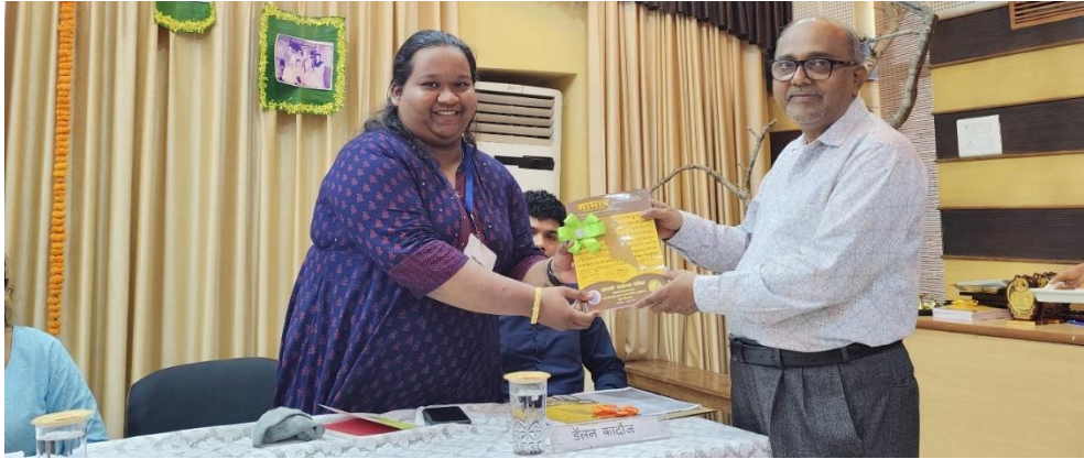
Ravindra Kelekar's Literature presentation by Students