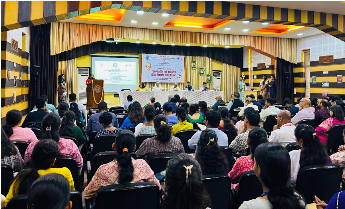
Welcome address by event coordinator