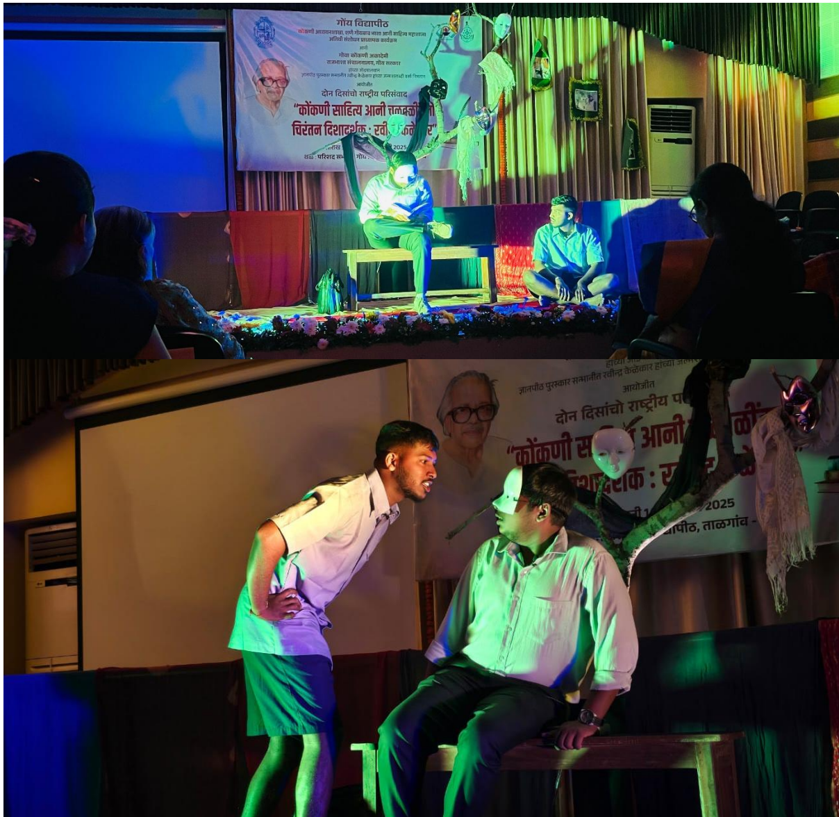
"Mukti" a drama written by Ravindra Kelekar and presented by students of GU