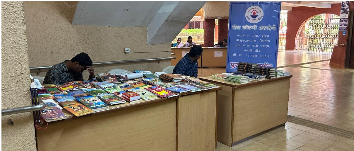
Book exhibition on Ravindra Kelekar