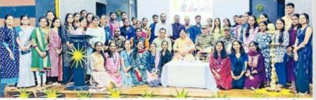
मराठी अध्ययनशाखा, गोवा विद्यापीठ आणि राष्ट्रीय छात्रसेना (एनसीसी) यांच्या संयुक्त विद्यमाने गोवा विद्यापीठात आयोजित 'रक्षाबंधन: भारतीय वीरांना अभिवादन' कार्यक्रमाला सहभागी भारतीय सैनिक, मान्यवर, प्राध्यापक, प्रशस्तकीय कर्मचारी आणि विद्यार्थी.