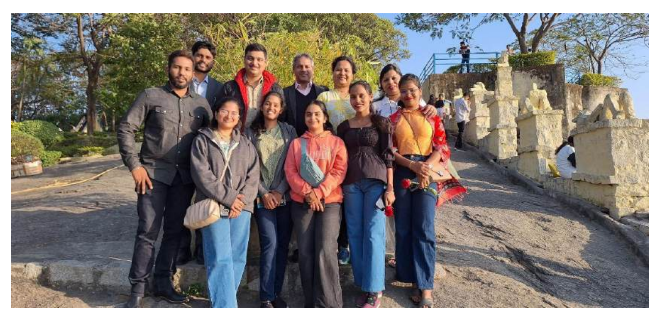
Visit to the Rock Garden of Ranchi in the Evening of 16th Feb., 2025