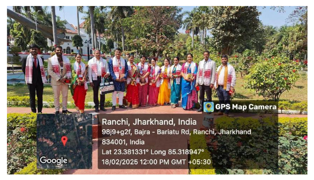
A Visit to the Raj Bhavan, Ranchi.