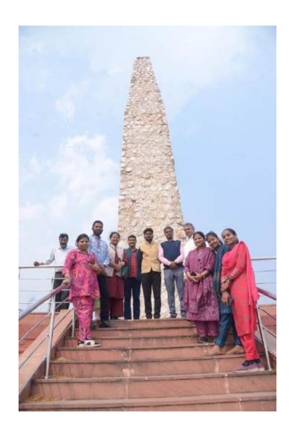
Visit to the Sombari Buru Memorial Built in the memory of the tribal massacred by Britishers in their sleep.