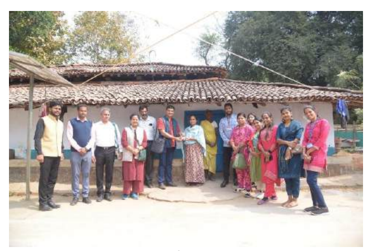
An Heritage Adivasi house of 150 Years