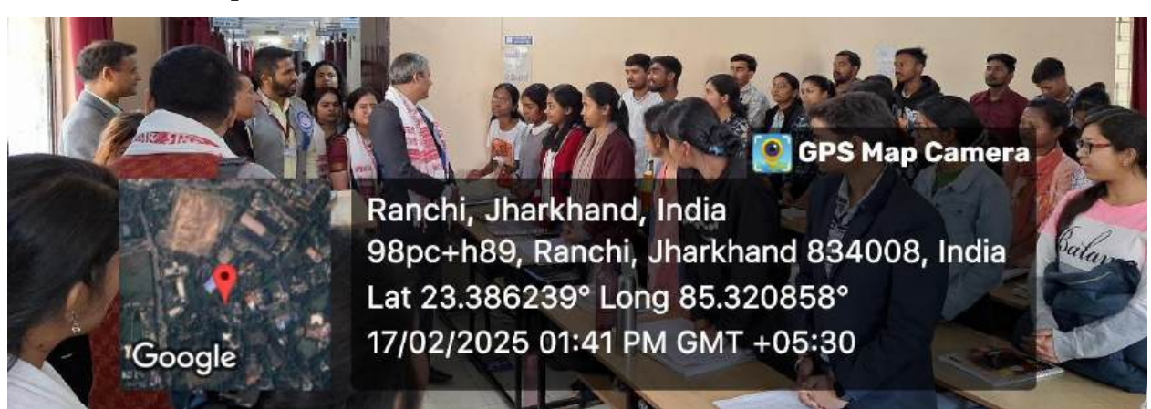
Interactions with the students of Department of English