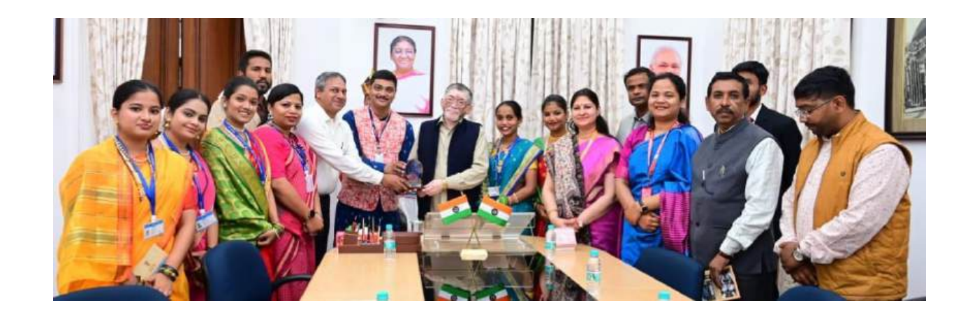
The EBSB delegation from Goa University presented His Excellency, the Governor of the State, with a memento from Goa University