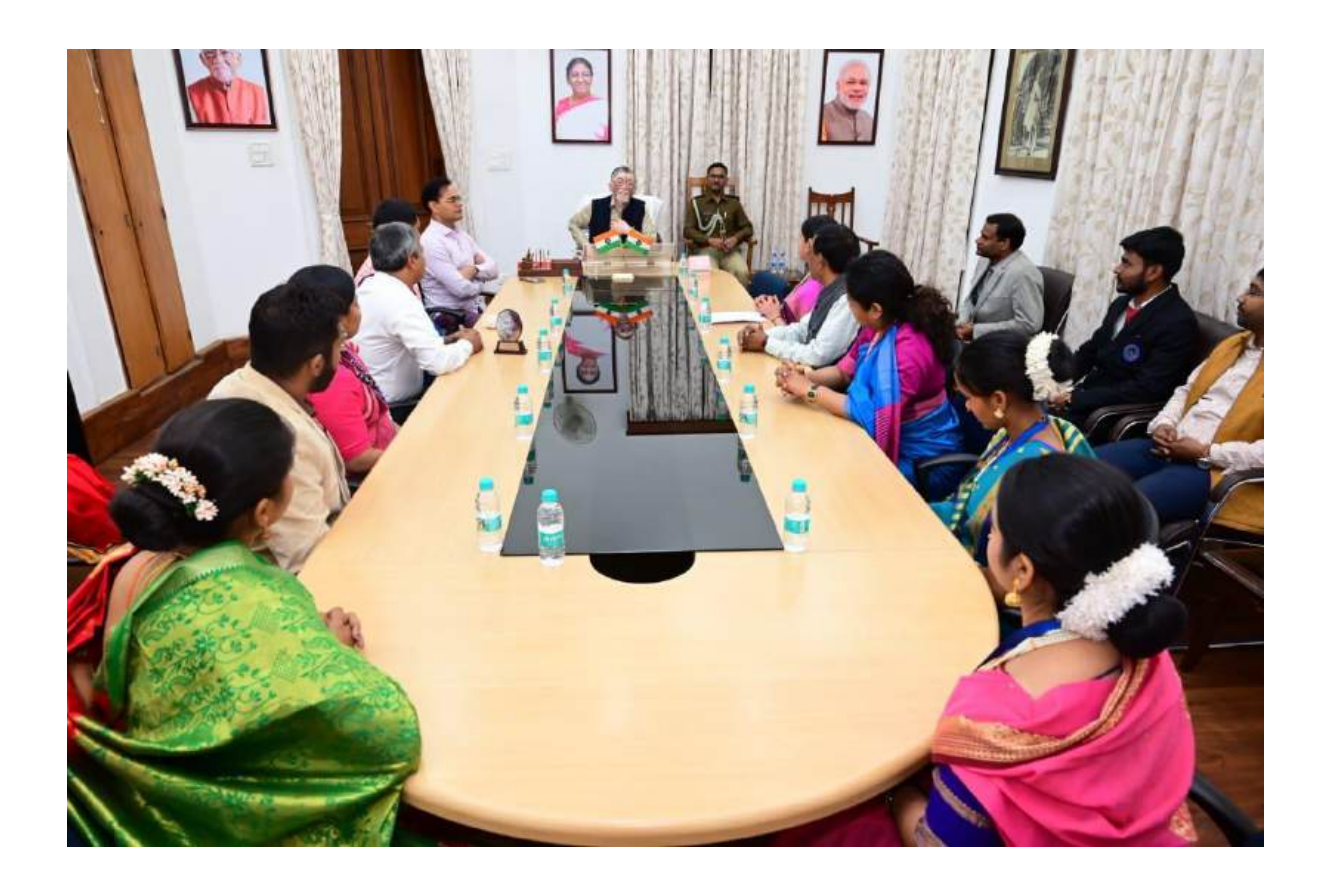
Meeting with the honourable Governor of Jharkhand