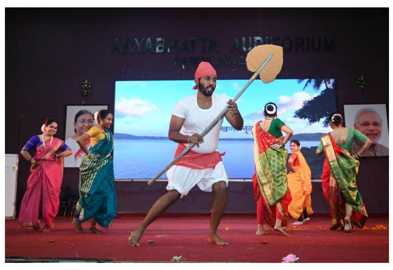
Presenting the Goan Culture in front of Ranchi University