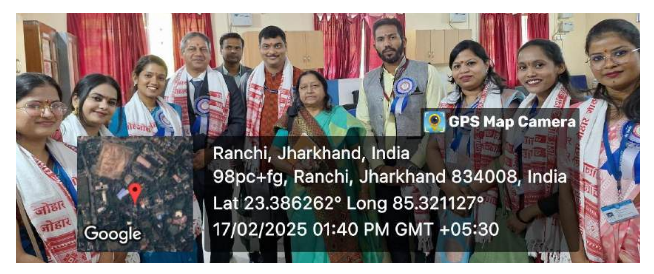
A visit to the department of Humanities and their Libraries