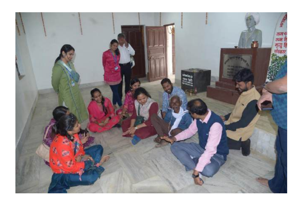
An Interactive session with the grandson of Birsa Munda