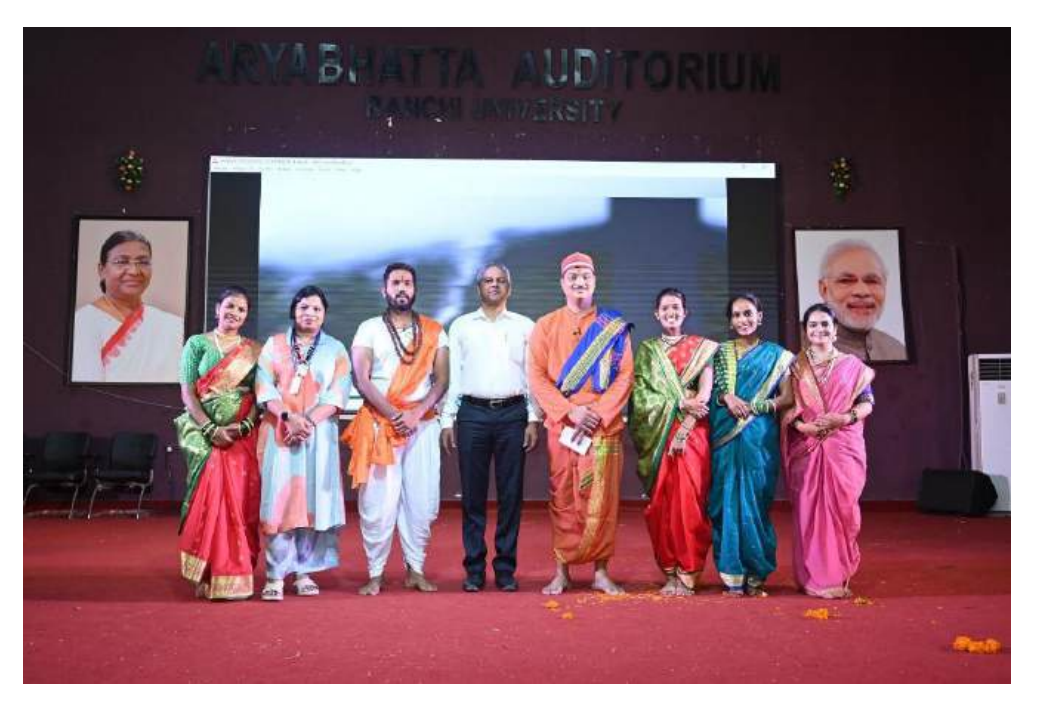
EBSB delegates of Goa University after the Cultural Performances