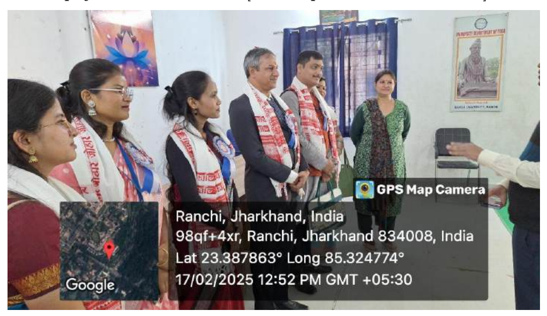
An educational visit to the yoga Department