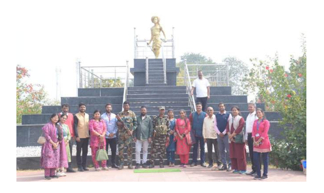
Visit to a tribal Village meeting with the Mukhya (sarpanch) of the Village