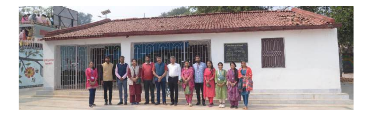
The house of Birsa Munda, and below is the memorial of Birsa Munda near his village