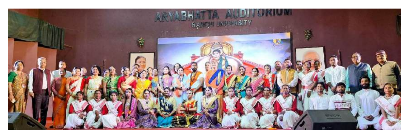
All performers of Ranchi University and Goa University