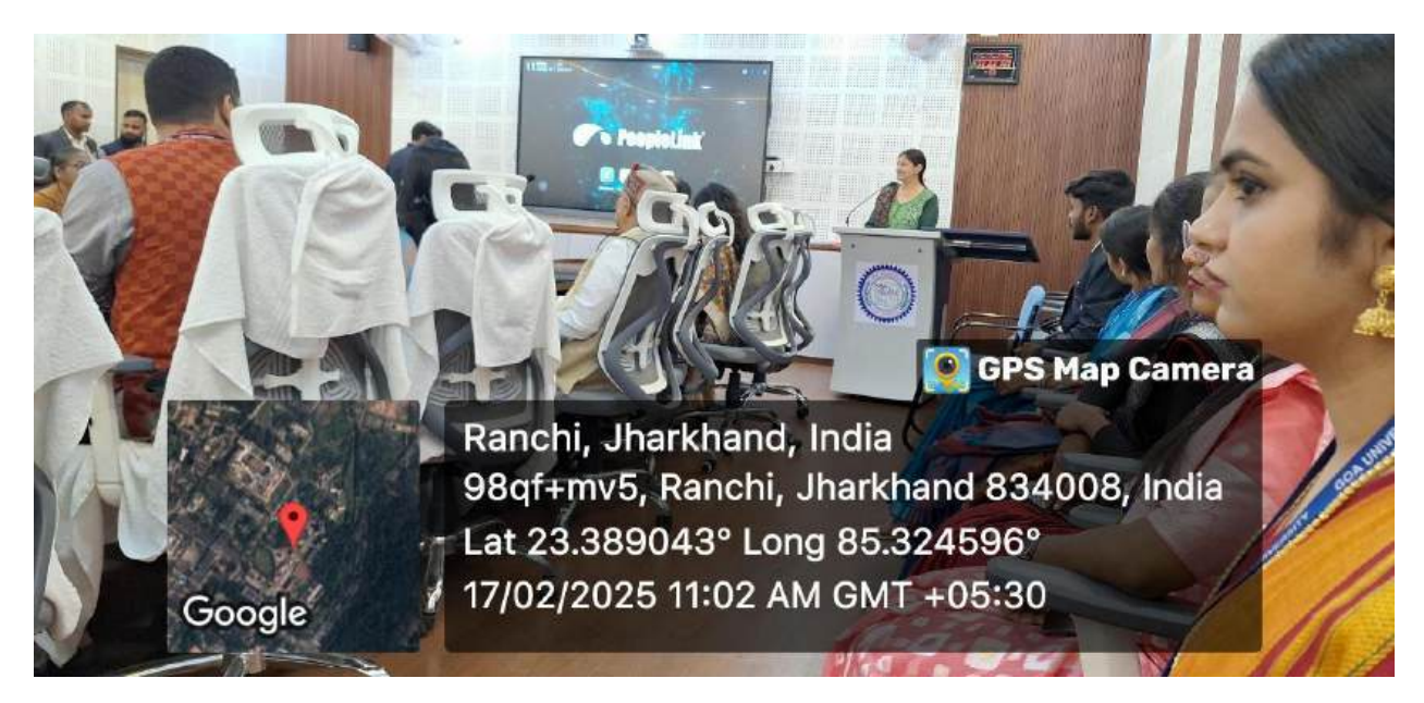
Formal welcome session with all faculties of Ranchi University