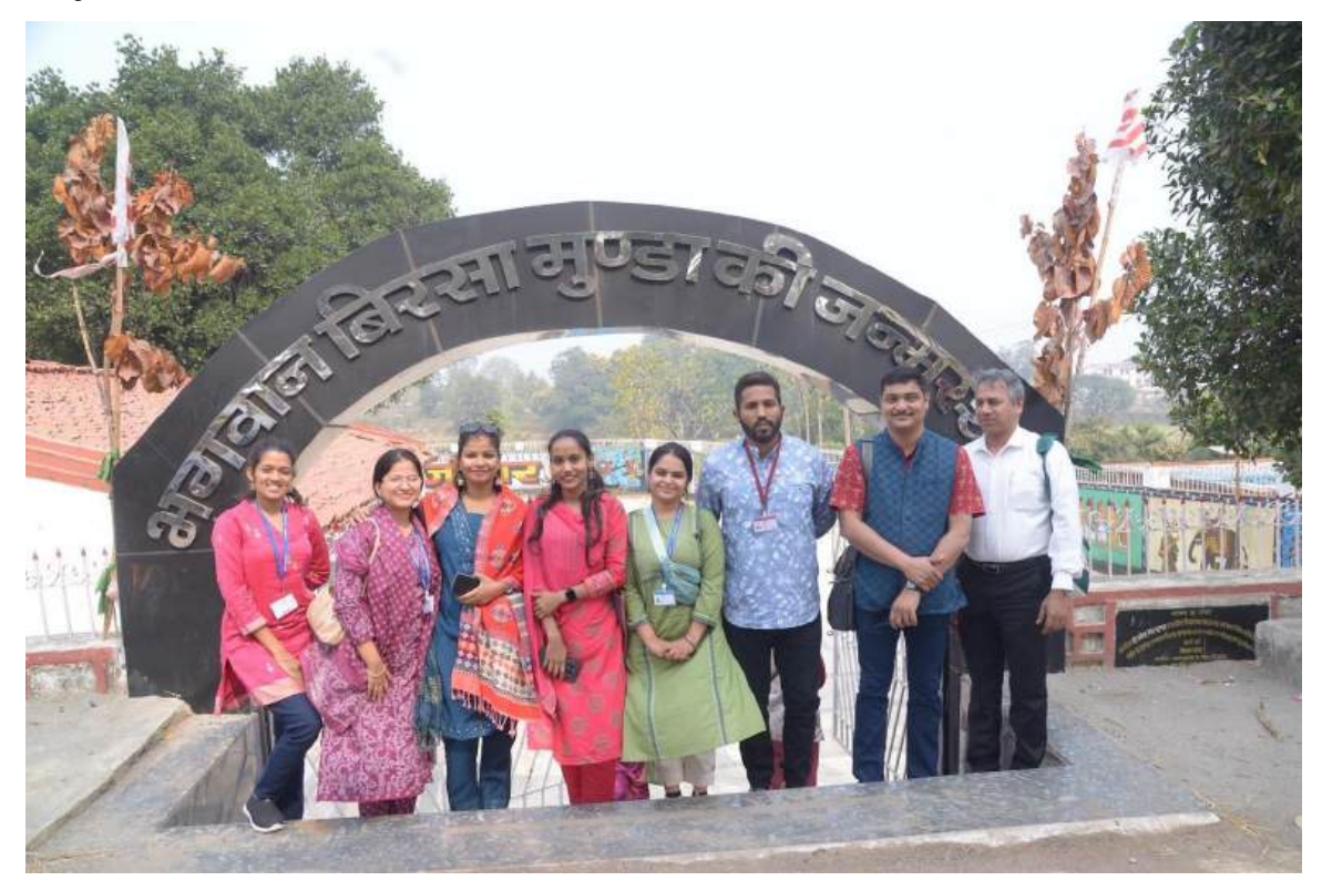
Day 3- 19 Feb. 2025

An Visit to the Birth Place of Birsa Munda