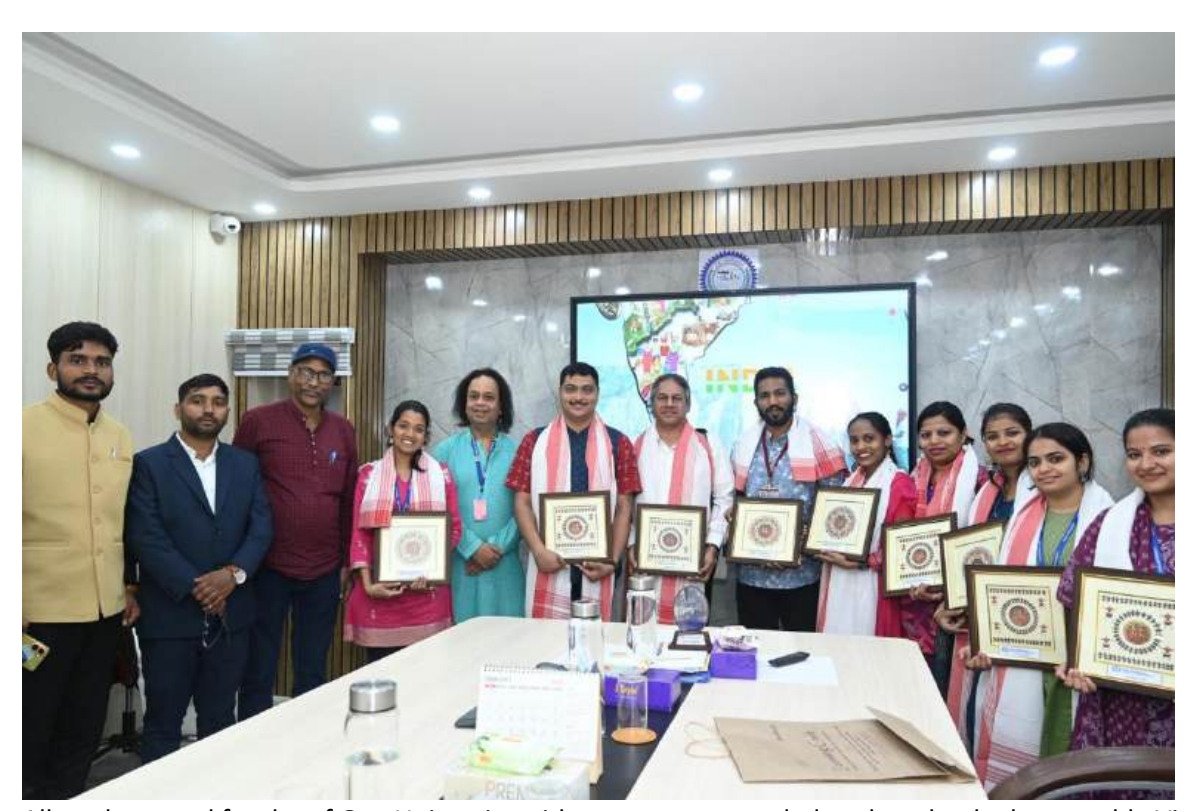
All students and faculty of Goa University with mementos awarded to them by the honourable Vice Chancellor of Ranchi University, Jharkhand