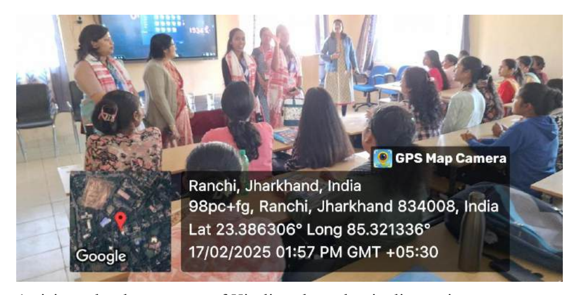
A visit to the department of Hindi and academic discussions