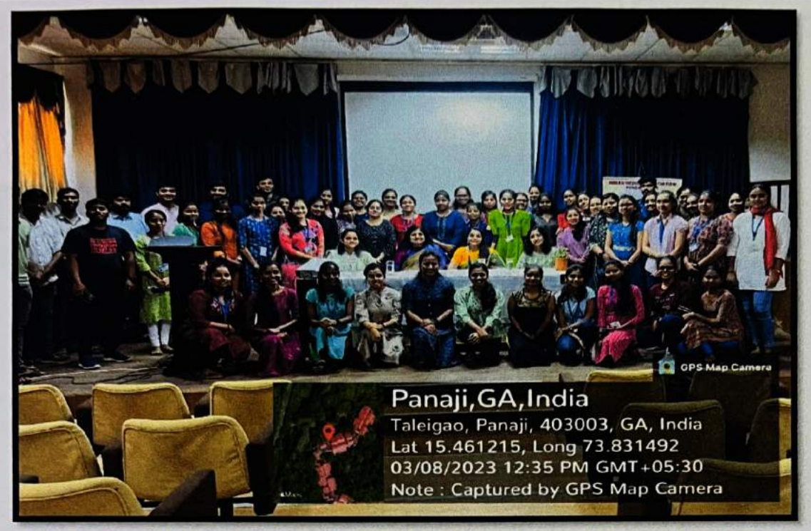
Students and Faculty members of SGSLL along with the dignitaries.